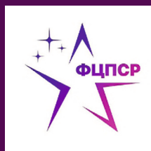
«Федеральный центр подготовки спортивного резерва»