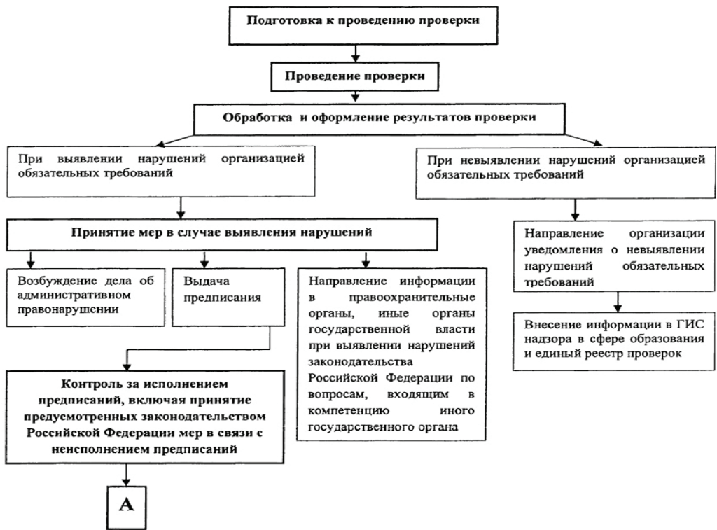
БЛОК-СХЕМА последовательности действий при исполнении государственной функции