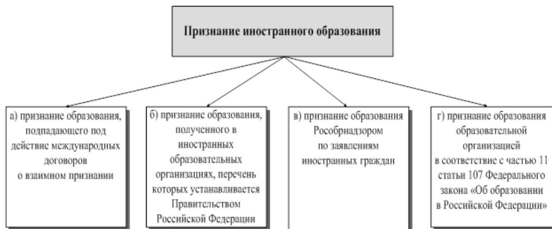
Рисунок 1. Признание иностранного образования в Российской Федерации